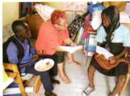
Kummien viestit menevät perille.