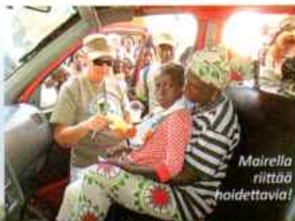
Mairella riittää hoitettavia!

Yhteistyössä paikallisten asiantuntijatahojen kanssa MMK on käynnistänyt myös valistustyön tyttöjen silpomisen ehkäisemiseksi.