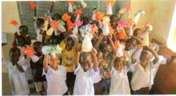
Juhlailoa Brufutin esikoulussa.

MMK. Maailma, me kaikki ry perustettiin, jotta mahdollisimman moni varaton gambialaisperhe saisi paremmat mahdollisuudet lähettää lapsensa koulutielle. Gambiassa koulujen opetuskieli on englanti. Mandinkaa tai muita heimokieliä puhuvan lapsen pitäisi kouluun mennessä osata ainakin englannin kielen. Maan virallista kieltä taitamattomille vanhemmille koulunkäynnin tukeminen on mahdotonta. Rahanmenoa aiheuttavat koulupuvut, kengät, sukat, reppu, matkakulut sekä kaikki koulutarvikkeet. Oppiminen edellyttää myös riittävää ravintoa.